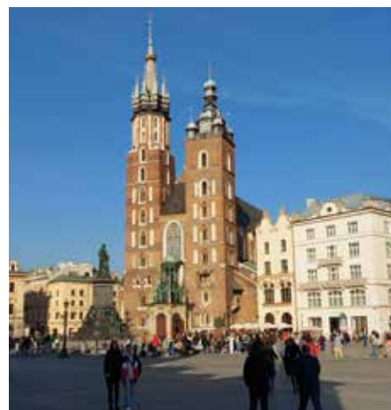
Krakau, das am 1. Tag besichtigt wurde, ist eine der wenigen polnischen Großstädte, die den Krieg nahezu unbeschadet überstanden. Sehenswert ist auf jeden Fall das Königsschloss auf dem Wawel (Burg) im Stil der Renaissance sowie die Kathedrale St. Stanislaus und Wenzel. Eines der Wahrzeichen Krakaus ist die Marienkirche (rechts), vom 13.-15. Jhdt. an der Stelle eines romanischen Vorbaus errichtet.