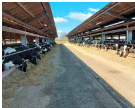
Landwirtschaftlicher Höhepunkt des 2. Tages war der Besuch des Viehzuchtzentrums in Nidek.